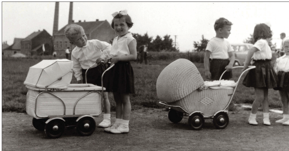
Dětský den 1966