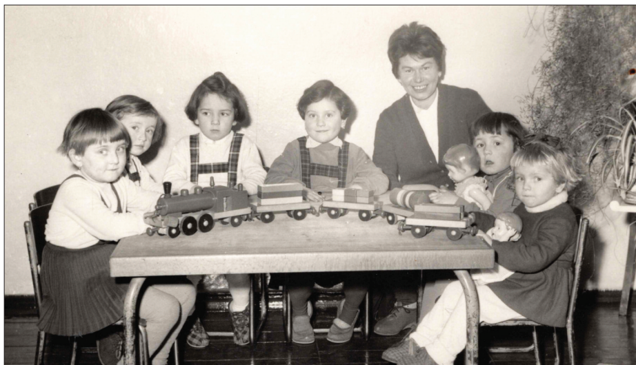
Mateřská škola 1966